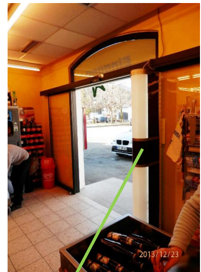
ESM-System am Eingang eines Geschäfts