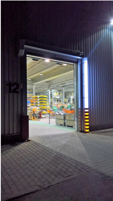
Für Toröffnungen bis max. 6m (mit 2 Systemen)