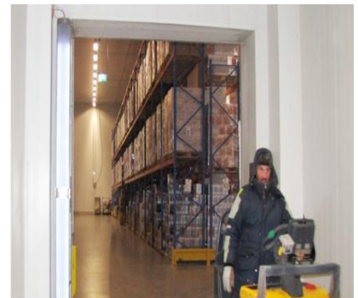
Deutliche Verminderung der gefährlichen Eisbildung im TK-Bereich