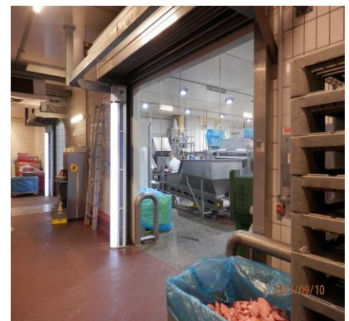
ESM-System in IP 55 Ausführung

Beleuchtung der Säulen zur Unterstützung der Optik im Produktions- oder Lagerbereich.